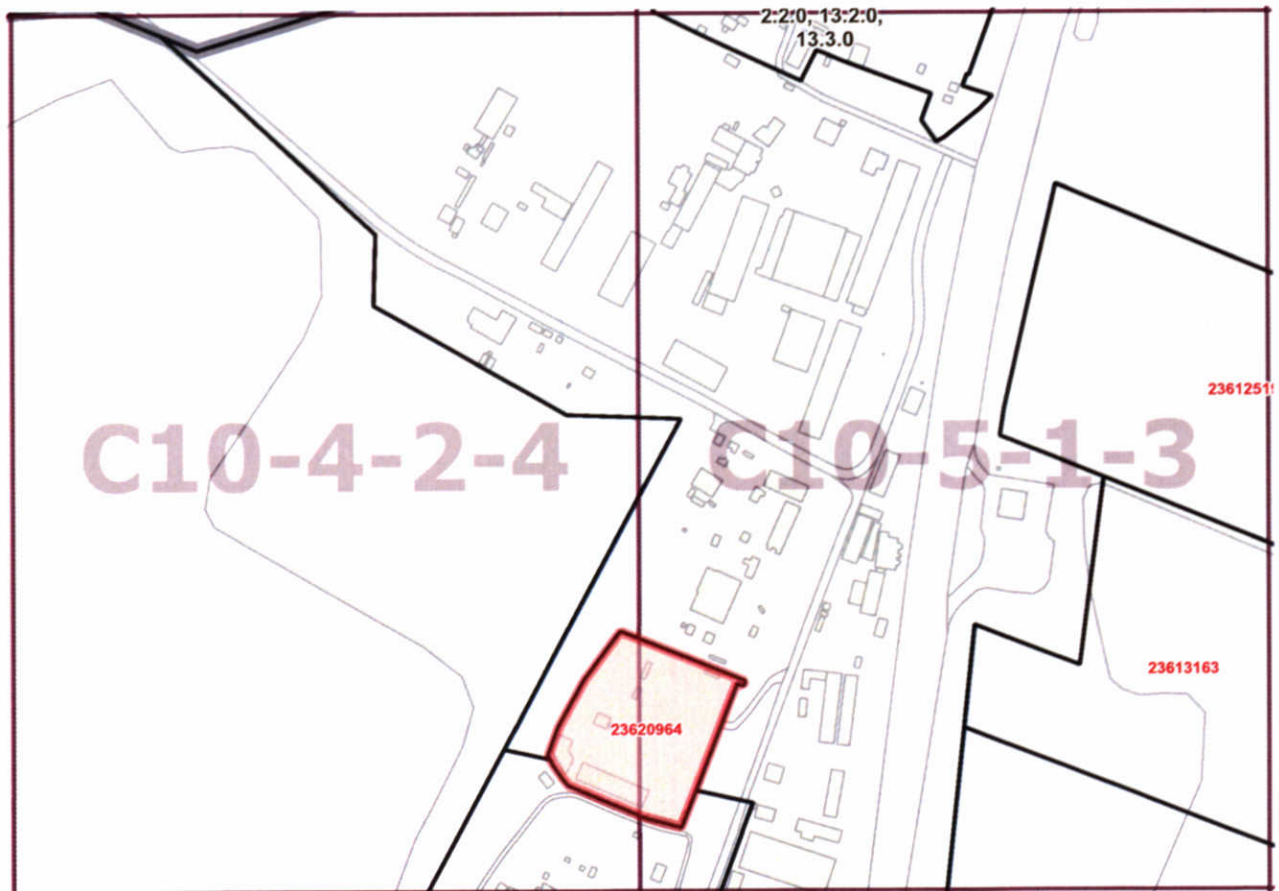
Схема границ подготовки проекта внесения изменений в правила землепользования и застройки города Москвы в отношении территории по адресу: г. Москва, поселение Краснопахорское, д. Красная Пахра, вл.127 (кад.№ 77:22:0020107:330), ТАО